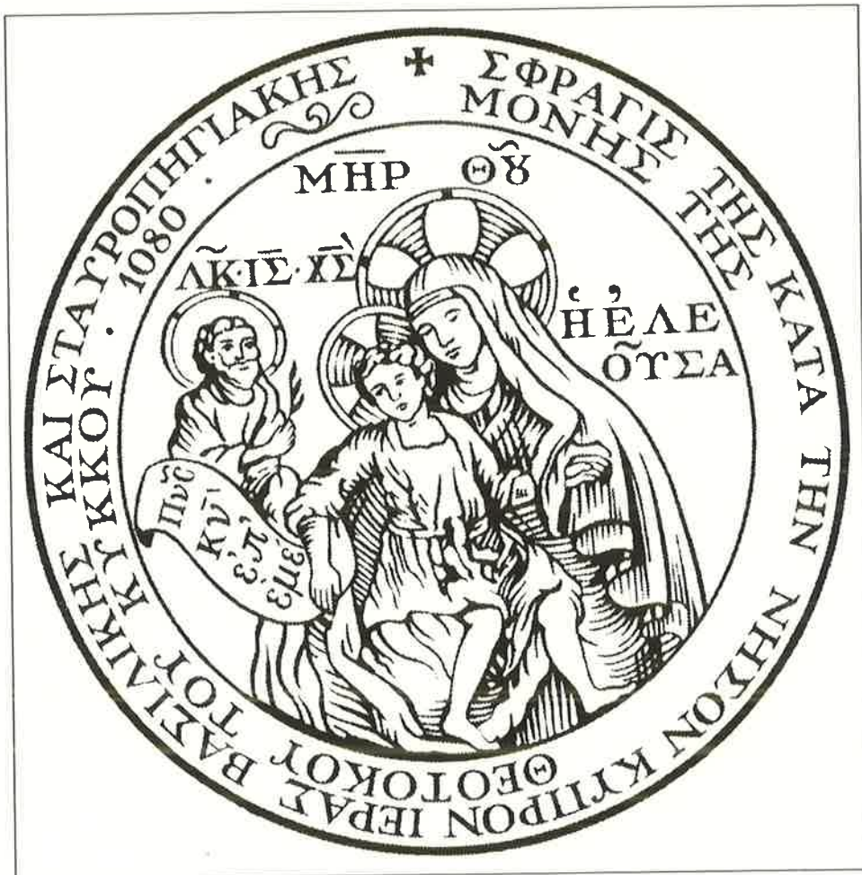
ΣΦΡΑΓΙΣ ΤΗΣ ΚΑΤΑ ΤΗΝ ΝΗΣΟΝ ΚΥΠΡΟΝ ΙΕΡΑΣ ΒΑΣΙΛΙΚΗΣ ΚΑΙ ΣΤΑΥΡΟΠΗΓΙΑΚΗΣ ΜΟΝΗΣ ΤΗΣ ΘΕΟΤΟΚΟΥ ΤΟΥ ΚΥΚΚΟΥ • 1080 •

ΚΕΝΤΡΟ ΜΕΛΕΤΩΝ ΙΕΡΑΣ ΜΟΝΗΣ ΚΥΚΚΟΥ ΕΤΟΣ ΙΔΡΥΣΕΩΣ: 1986