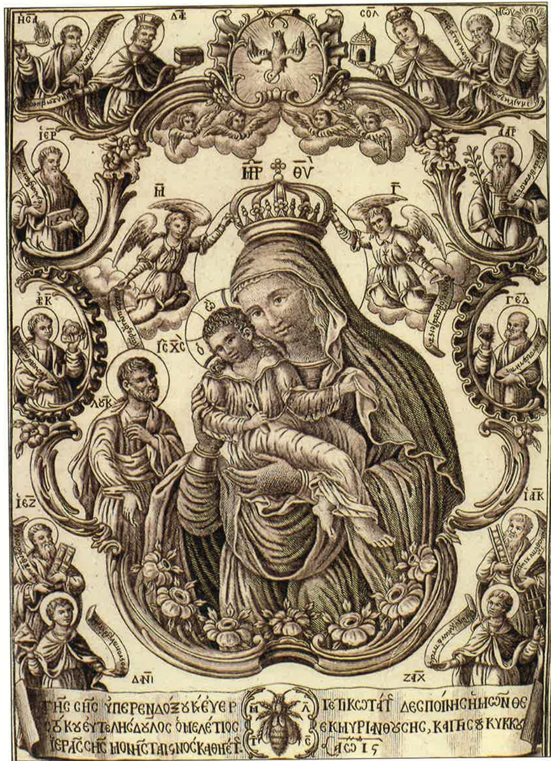
18. KYKKOS MONASTERY, MUSEUM. PRINT OF THE KYKKOTISSA OF 1816. 18. ΚΥΚΚΟΣ. ΜΟΥΣΕΙΟ. ΓΚΡΑΒΟΥΡΑ ΤΗΣ ΚΥΚΚΩΤΙΣΣΑΣ ΤΟΥ ΕΤΟΥΣ 1816.