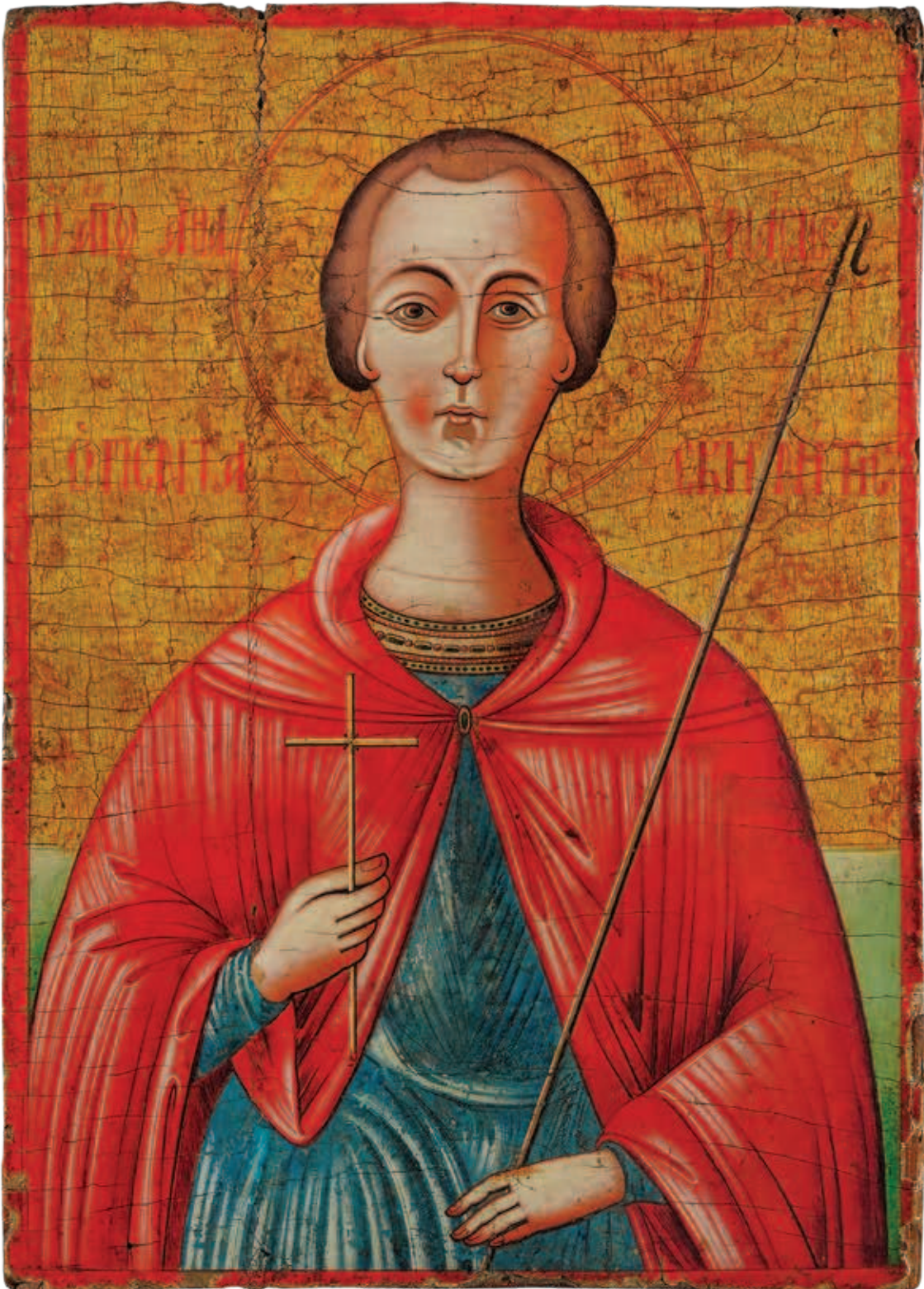
Εικόνα 7: Ο Άγιος Αθανάσιος ο Πεντασχοινίτης με ποιμενική ράβδο (19ος αι., φορητή εικόνα, Ιερός Ναός Αγίου Θεοδώρου του Τήρωνος στο χωριό Άγιος Θεόδωρος Λάρνακας).