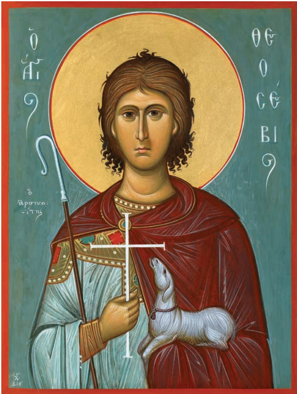
Εικόνα 6: Ο Άγιος Θεοσέβιος ο Αρσινόιτης (2019, φορητή εικόνα Χαράλαμπου Επανεινόνδα, Ιερά Μονή Αγίου Γεωργίου Μαυροβουνίου).