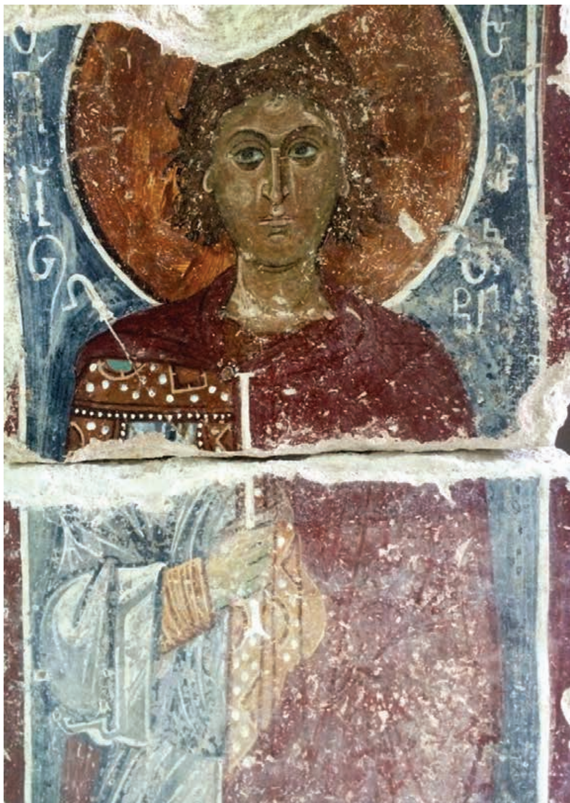
Εικόνα 5: Ο Άγιος Θεοσέβιος ο Αρσινόιτης (12ος αι., Χωρεπισκοπή Αρσινόης).