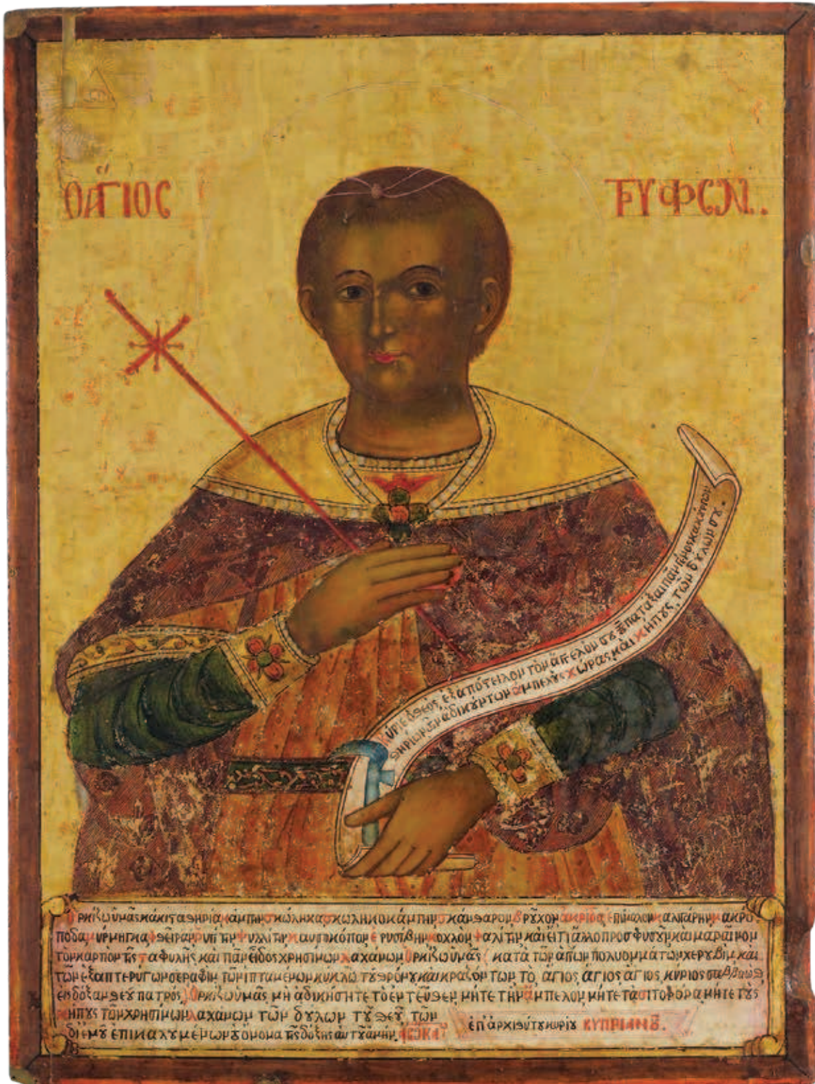
Εικόνα 4: Ο Άγιος Τρύφωνας (1821 μ.Χ., φορητή εικόνα Μιχαήλ προσκυνητού, Ιερά Μονή Αγίου Μηνά).