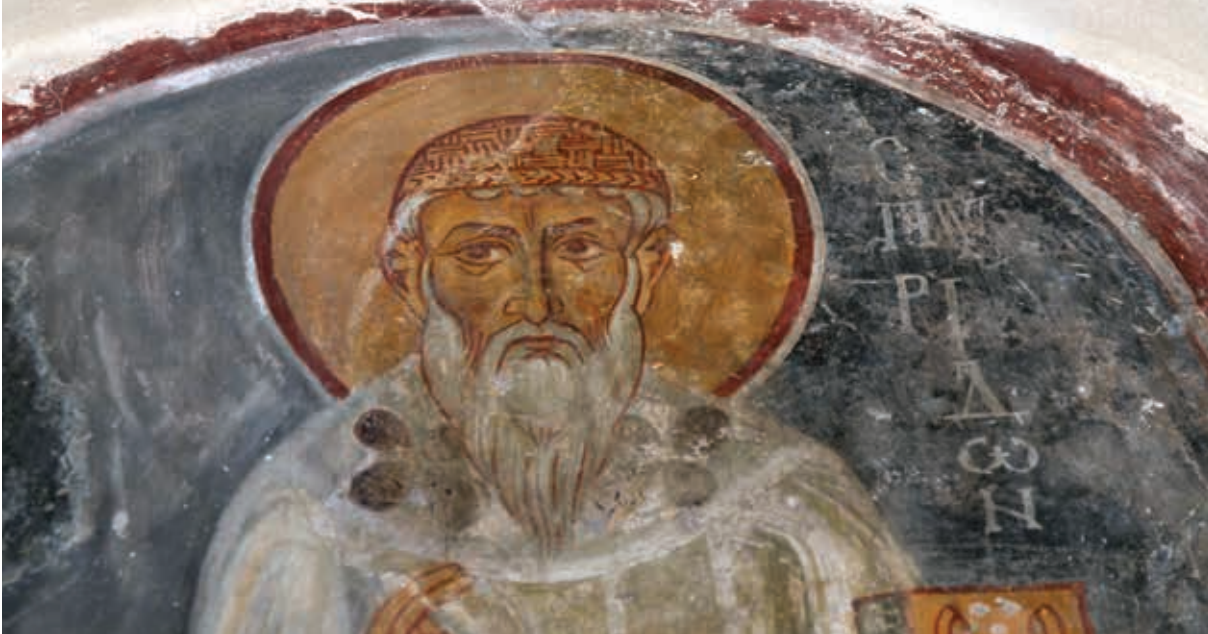
Εικόνα 2: Ο Άγιος Σπυρίδωνας (12ος αι., Τοιχογραφία, Καθολικό Ιεράς Μονής Παναγίας Αμασγού).