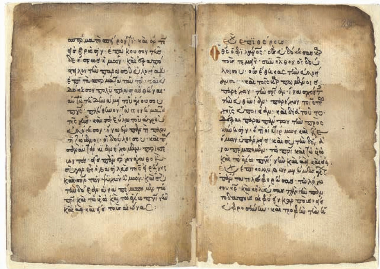
Εικόνα 2: Αρχιεπισκοπής 67, φφ. 209β-210α.

εὐλόγησας καὶ ἐπλήθυνας τοῦ πατριάρχου Ἰακώβ τὰ ποίμνια, εὐλόγησον καὶ τὴν ποίμνην τῶν κτηνῶν τούτων, καὶ πλήθυνον καὶ ἐνδυνάμωσον αὐτήν, ἀποδίωξον ἀπ’ αὐτῆς πᾶσαν ἀσθένειαν, πάντα φθόνον καὶ πειρασμόν, νόσου λοιμικοῦ καὶ φαρμακείας (φ. 189α) καὶ γοητείας ἐξ ἐνεργείας ἐπερχομένης τοῦ διαβόλου. Ὅτι σοῦ ἐστὶν ἡ βασιλεία καὶ ἡ δύναμις καὶ ἡ δόξα, τοῦ Πατρὸς καὶ τοῦ Υἱοῦ καὶ τοῦ ἁγίου Πνεύματος, νῦν καὶ ἀεὶ καὶ εἰς τοὺς αἰῶνας τῶν αἰώνων. Ἀμήν».