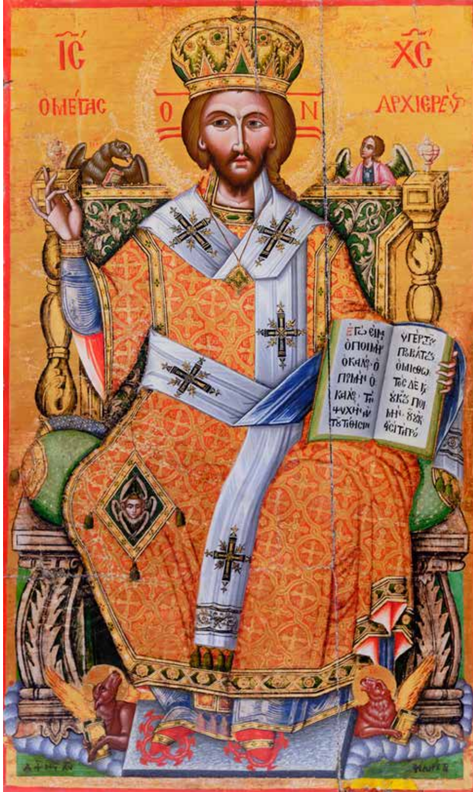
Εικόνα 1: Ιησούς Χριστός, «Ο Μέγας Αρχιερέυς» (1756 μ.Χ., φορητή δεσποτική εικόνα Φιλαρέτου με το ανοικτό Ευαγγέλιο να αναφέρεται στον Καλό Ποιμένα Χριστό [Ιω 10,11-12α], Ιερός Ναός Παναγίας Σιά).