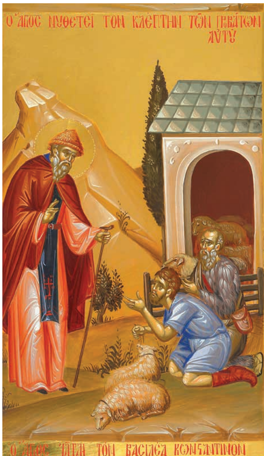
Εικόνα 3: Ο Άγιος Σπυρίδωνας νουθετεί τους κλέφτες των προβάτων του (2010, εργαστήριο αιοιογραφίας "Ο Αντιφωνητής". Λεπτομέρεια από Βιογραφική φορητή εικόνα του Αγίου Σπυρίδωνα, Επισκοπείο Ιεράς Μητροπόλεως Τριμυθούντος).