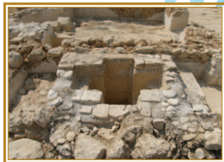
Βαπτιστήριο Παναγίας Πετοῦντας στὸν Μαζωτό, βαπτισματικὴ κολυμβήθρα

Οἱ βαπτίσεις στὴν Κύπρο μέχρι καὶ τὰ τέλη τοῦ 7ου αἰ. εἶναι ὁμαδικές καὶ ἀναφέρονται κυρίως σὲ ἐνήλικες. 35 Ὁ ἴδιος ὁ ἐπίσκοπος προσωπικά, ἐπιμελεῖται τὸ ζήτημα τῆς κατήχησης, ὀρίζει ποιὸς καὶ πότε θὰ ἐγγραφεῖ στὸν κατάλογο γιὰ κατήχησι καὶ προετοιμασία, γιὰ