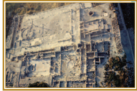
Βασιλικὴ Κουρίου μὲ τὸν χώρο τοῦ Βαπτιστηρίου

Παρόλο πὺ δὲν γίνεται ἄμεση ἀναφορὰ στὴ χρήση μὲ τὸ Ἅγιο Μύρο, αὐτὴ θεωρεῖται αὐτονόγη καὶ ἀκο-