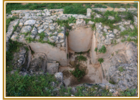
Βασιλικὴ Ἁγίας Τριάδας στὴν Ἁγία Τριάδα Γαλοῦσας, βαπτισματικὴ κολυμβήθρα

3. Τέλος, γίνεται αναφορά στο βάπτισμα τοῦ παιδιοῦ ἐνὸς Συγκλητικοῦ ἀπὸ τὴν Κωνσταντινούπολη κατὰ τὴν παννυχίδα-ἀγρυπνία τοῦ Μεγάλου Σαββάτου. Τὸ μυστήριον ἱερουργεῖ ἓνας ἱερέας, ὁ ὁποῖος ἀφοῦ ὀλοκληρώσει ὅλα τὰ διατεταγμένα τῶν καθορισμένων εὐχῶν βαπτίζει τὸ παιδί στὴν κολυμβήθρα στὸ ὄνομα τῆς Ἁγίας Τριάδας. 24