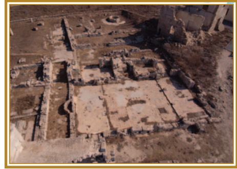
Βασιλικὴ Ἁγίου Φίλωνος στὸ Ριζοκάρπασο, Βαπτιστήριον

4. Ἀναφορὰ σὲ βαπτίσεις γίνεται ἐπίσης στὶς περιπτώσεις: βάπτισις τοῦ φιλοσόφου στὸν Μέγα Ἰλαρίωνα, 11 βάπτισις στὴν Κωνσταντία τοῦ ἄρχοντα Δράκου καὶ τῆς συζύγου του, 12 βάπτισις τοῦ πλούσιου