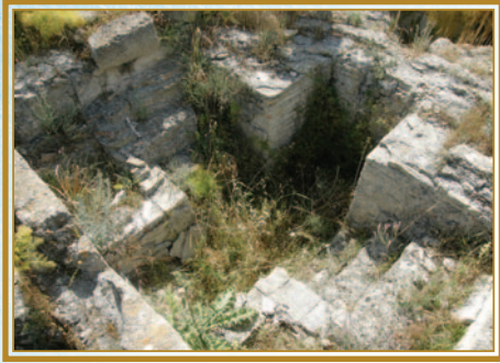
Βασιλική Αγίου Ἐπιφανίου, βαπτισματική κολυμβήθρα

πιοι τοῦ ἐπισκόπου. Μὲ τὴν ἄφιξη τοῦ ἐπισκόπου, οἱ δύο κατηχούμενοι, ἔπεσαν μὲ τὸ πρόσωπο στὴ γῆ παρακαλῶντας ὅπως λάβουν τὸ φῶτισμα τοῦ βαπτίσματος. 5