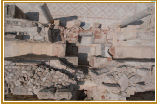
Βασιλικὴ Κουρίου, βαπτισματικὴ κολυμβήθρα

ἀπὸ τοὺς Ἀποστόλους Βαρνάβα καὶ Μάρκο: ὑπογραμμίζεται ὁ πόθος, ἡ πίστις καὶ ὁ ζήλος του γιὰ τὸν Χριστό, ἡ κατήχησις πὺν λαμβάνει καὶ ἡ βάπτισις στὸ ὕδωρ τῆς πηγῆς εἰς τὸ ὄνομα τῆς Ἁγίας Τριάδας, καὶ τέλος ἡ μετάδοσις τοῦ Ἁγίου Πνεύματος μὲ ἐπίθεσις τῶν χειρῶν τοῦ Ἀποστόλου. 35